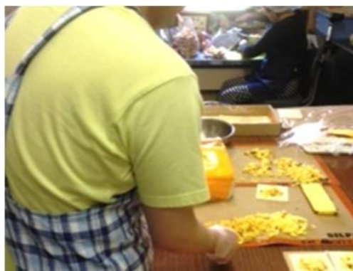
山鹿市内の就労継続支援 A 型事業所での実習。（福祉的就労）