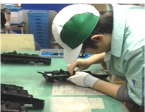
山鹿市内の製造関連の会社での実習。（一般就労）

今回の実習では、スイーツ工房でのお菓子作り、旅館のトイレの掃除や施設内での内職作業などを体験させて頂きました。就職について色々悩んでいます、自分に合う仕事が見つかるように残りの期間、頑張りたいと思います。