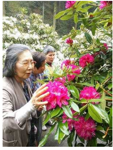
大輪の石楠花を愛でている参加者の方々。

午後から石楠花(しゃくなげ)が沢山咲いている公園を見に行きました。白やピンク色の花が咲きとてもきれいでした。