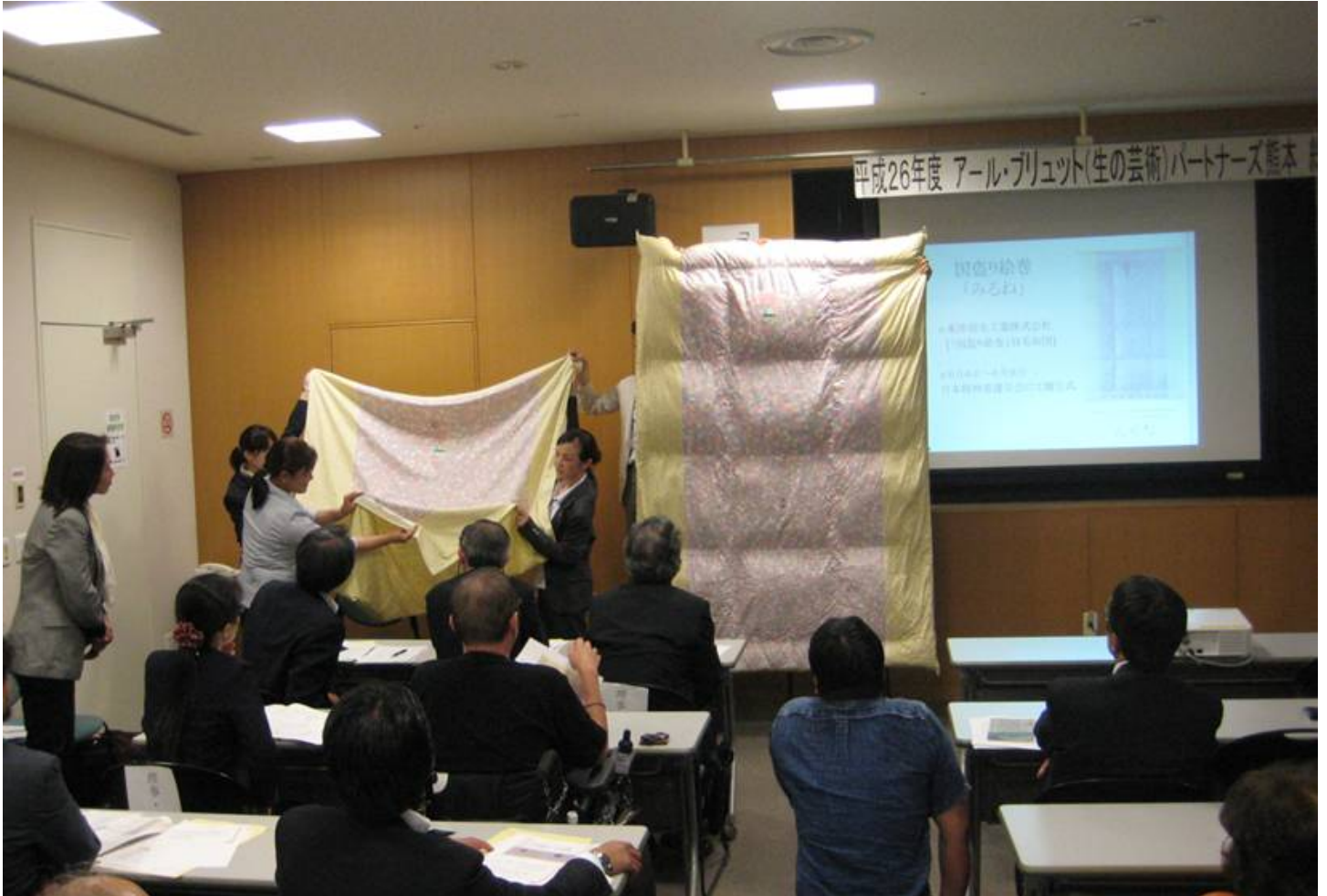
(写真：松本寛庸氏の作品「国盗り絵巻」が羽毛布団として製品化・「ひろのぶ」のサインを見つけているところです)